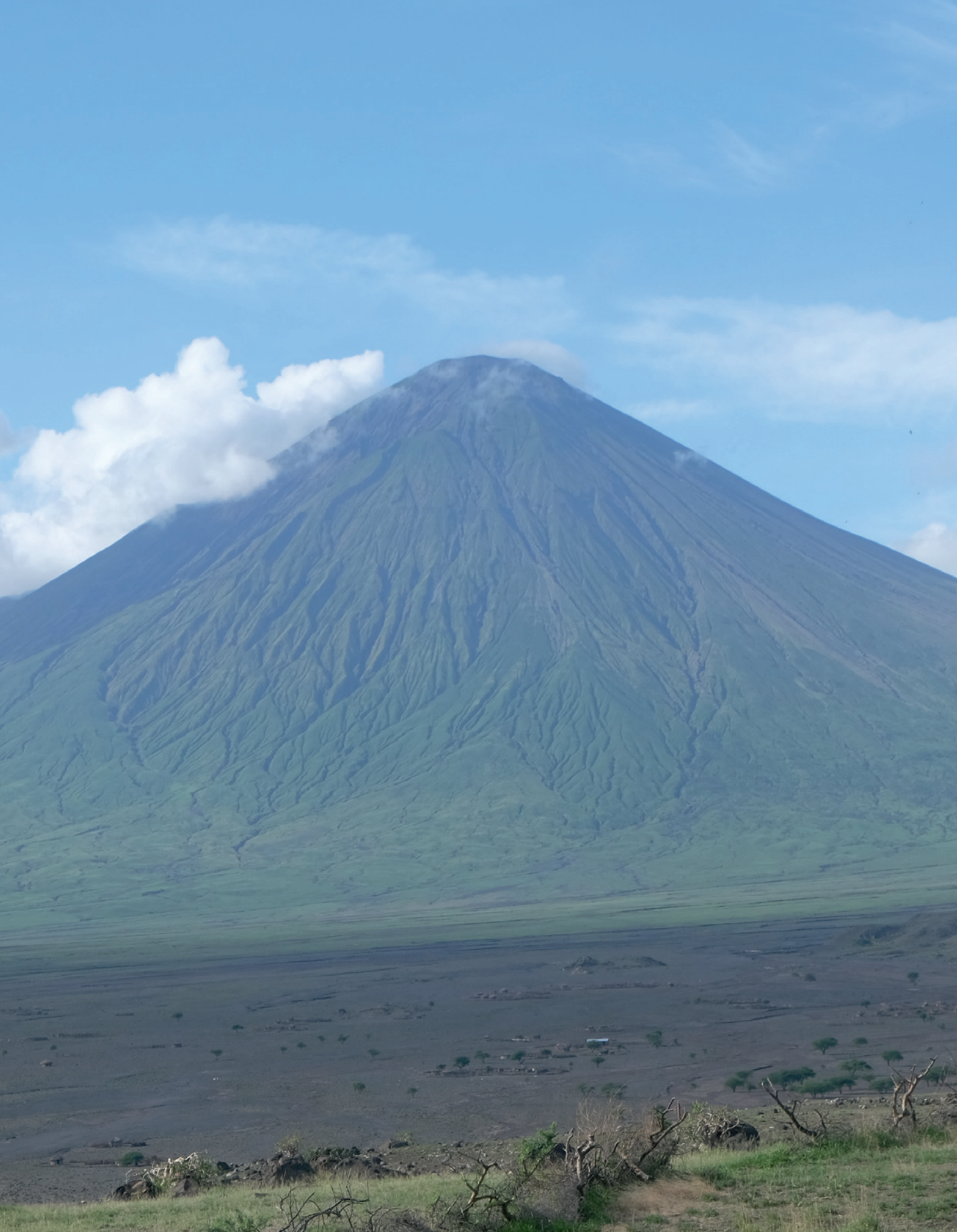
Ol Donyo Lengai, der von den Maasai als „Berg Gottes“ bezeichnete aktive Vulkan im Ngorongoro Gebiet