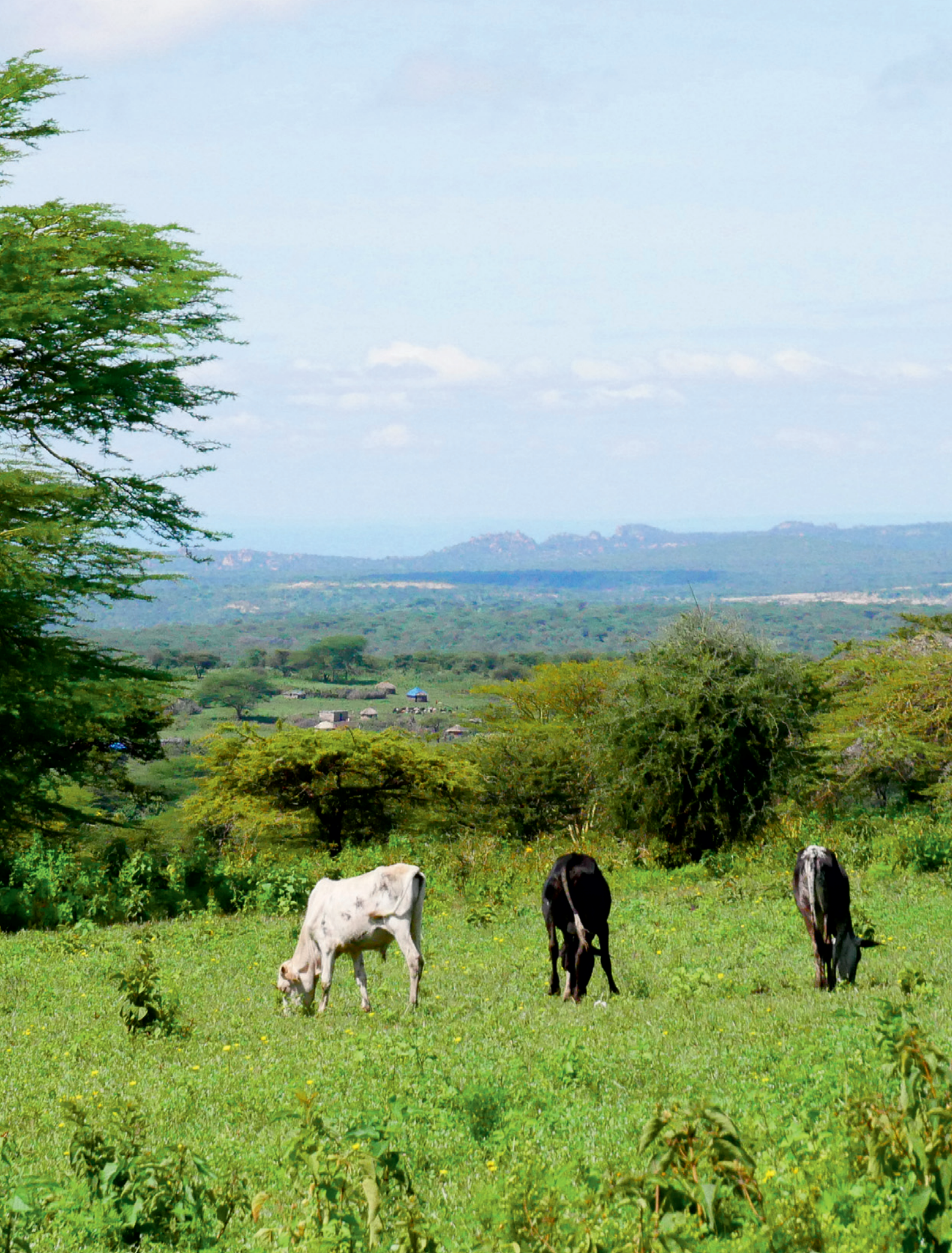
Grasende Rinder im Maasai-Dorf Endulen