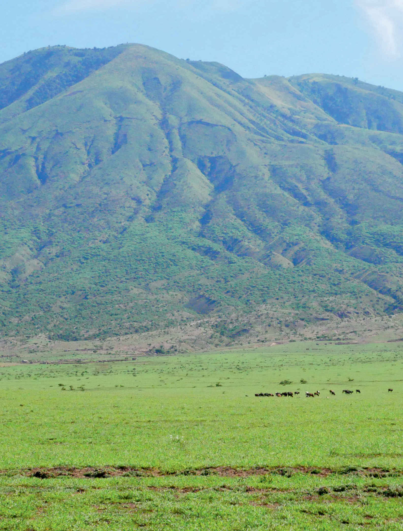
Grasende Rinder vor einem Vulkan in Ngorongoro