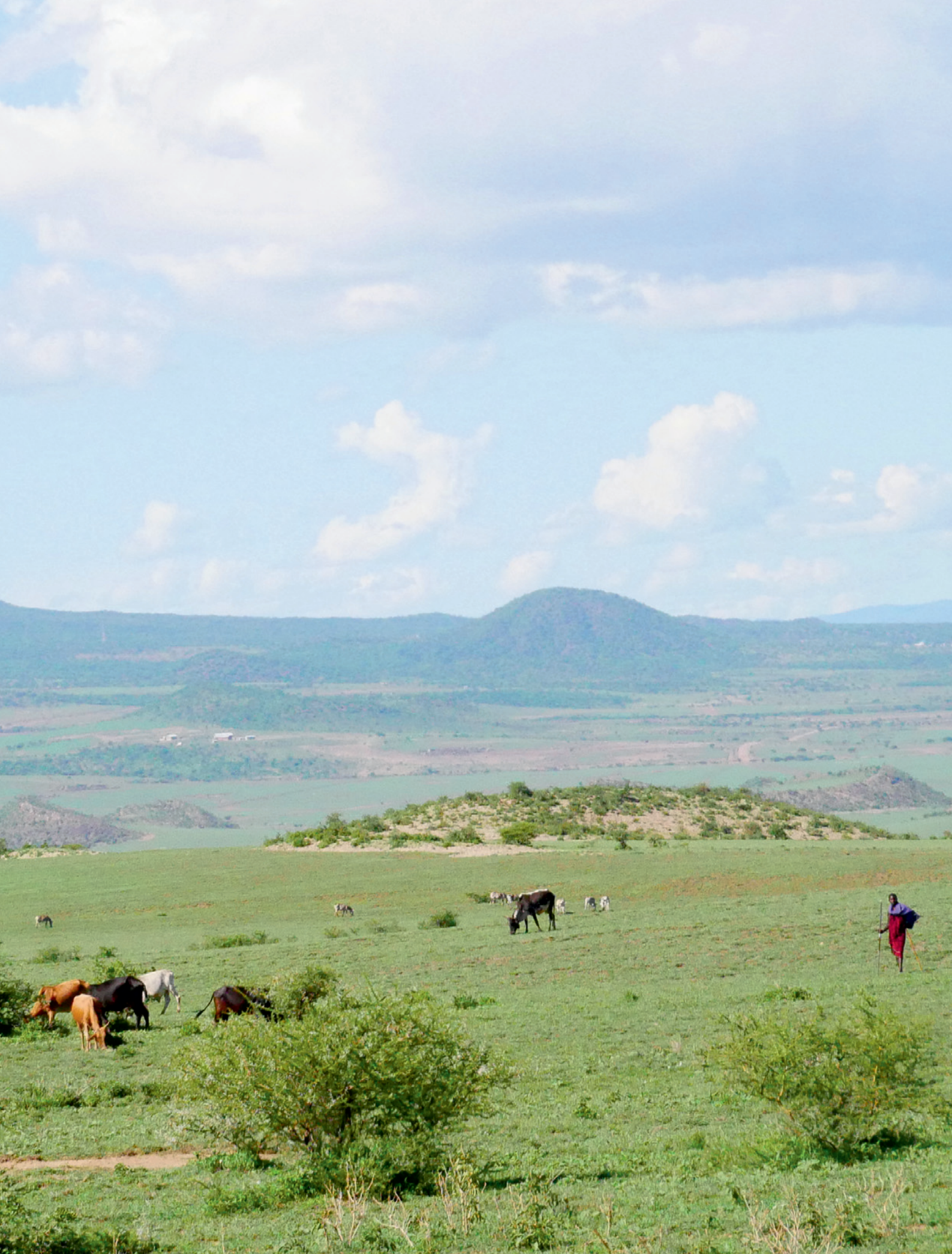
Maasai und Rinderherden im Ngorongoro-Gebiet